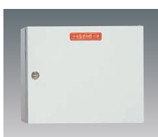
BV95331H(内器) BV8311H(露出ボックス)